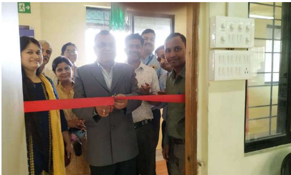
Photo-2: Inauguration of Marketnama by Director-Dr. Shivaji Mundhe