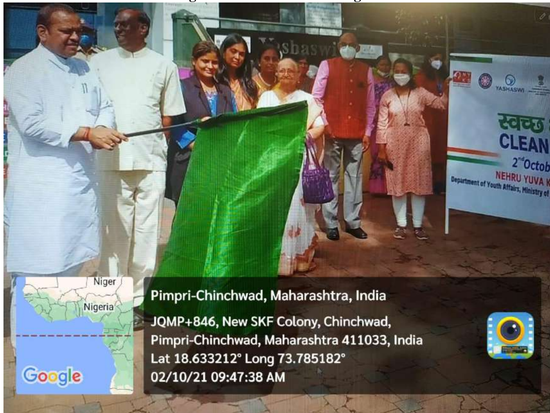
Showing the green flag for plugging run