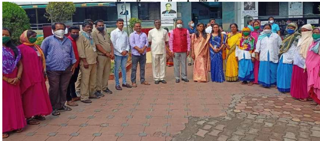
Photo with PCMC housekeeping Staff