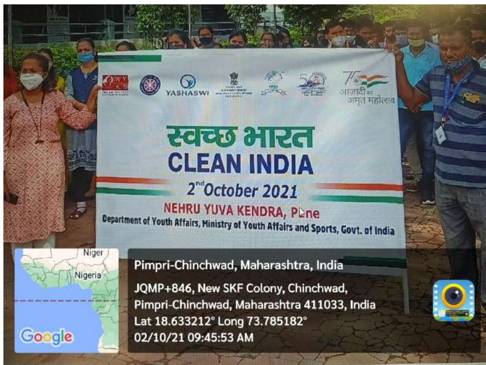
Ready for plugging run from Yashaswi IIMS Campus to Chafekar Chowk