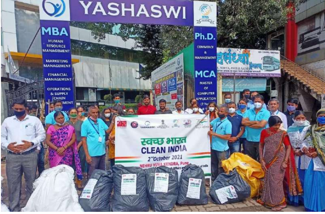
Garbage collected from plugging run