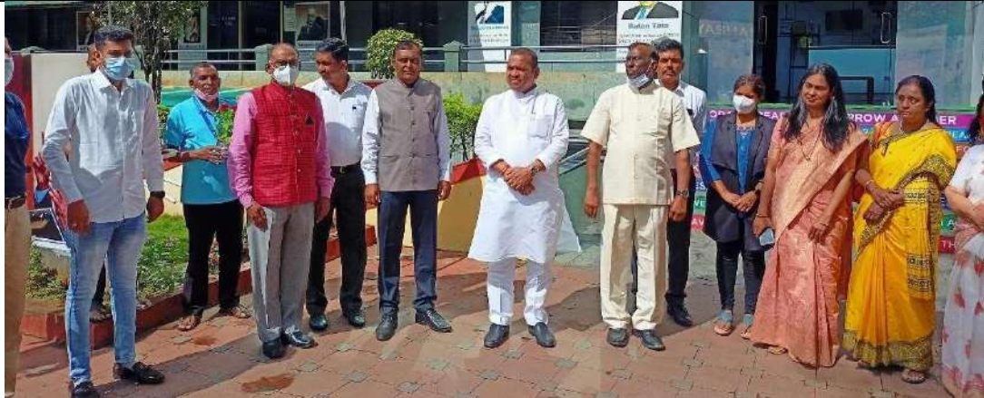
Addressing Honourable Mr. Shrirang Barne-MP