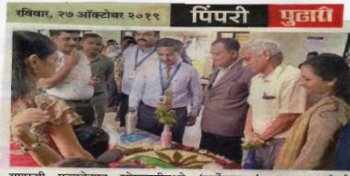
शरद्वी एज्युकेशन सोसायटीमध्ये 'मार्केटनामा' या उपक्रमांतर्गत विद्यार्थ्यांनी विविध वस्तूंचे स्टॉल प्रदर्शित केले.

1. Special edge in 2. Provide rich & fit 3. Providing to meet 4. To satisfy 5. Quality Me We shall s Improved in